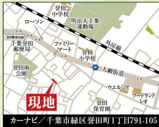
カーナビ / 千葉市緑区誉田町1丁目791-105