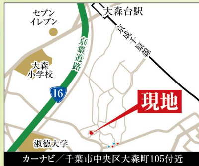
カーナビ / 千葉市中央区大森町105付近

誉田町にて同じ仕様が見学できます!! 詳しくはお電話または誉田町現地へお越し下さい!!